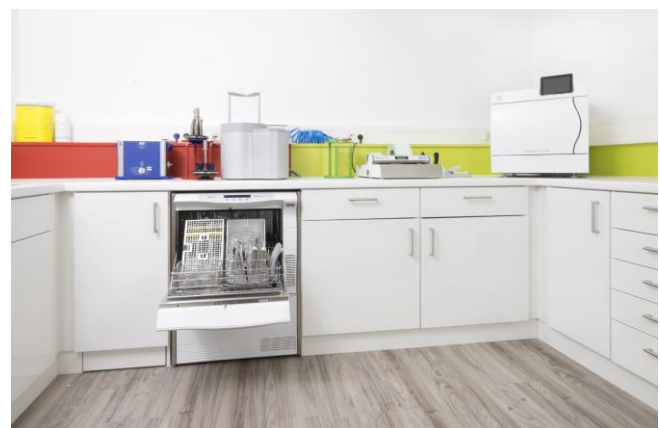
Zuverlässige Aufbereitung mit MELAG-Geräten auf kleinem Raum